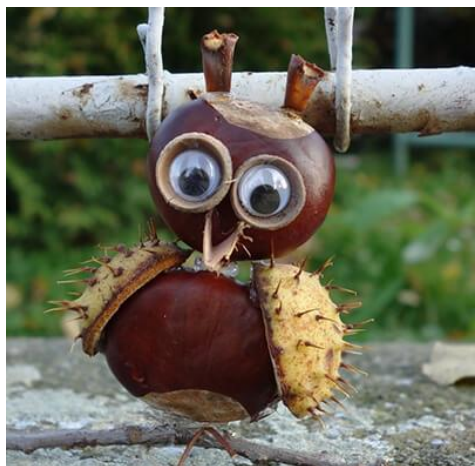
Сова из каштанов