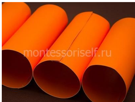
Рулоны из бумаги

Склеиваем из ярко-оранжевой бумаги рулоны.