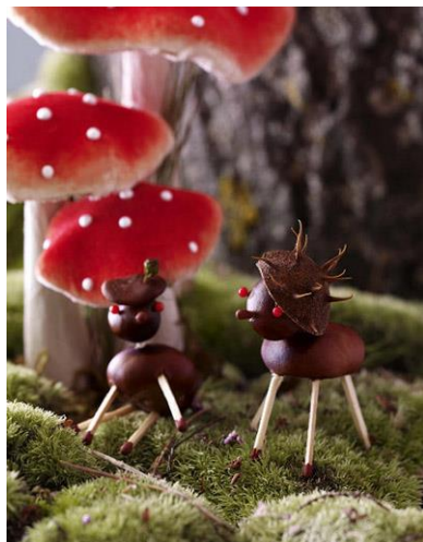
Поделка с ножками из спичек

Из спичек очень легко сделать ножки для животного. Понадобится сделать четыре небольших отверстия в каштане и вставить туда спички.