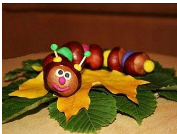
Гусеница из каштанов

Соединив при помощи пластилина друг с другом несколько плодов каштана, мы получим замечательную гусеницу. Достаточно дополнить ее подсушенными листьями деревьев – и полноценная композиция для осенней выставки поделок готова.