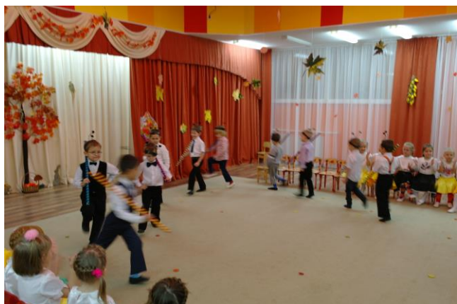
Знакомство с символами России