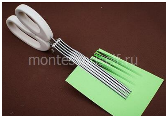
Нарезаем бумагу соломкой

Складываем несколько листов зеленой бумаги. С помощью специальных или обычных ножниц нарезаем бумагу «соломкой».