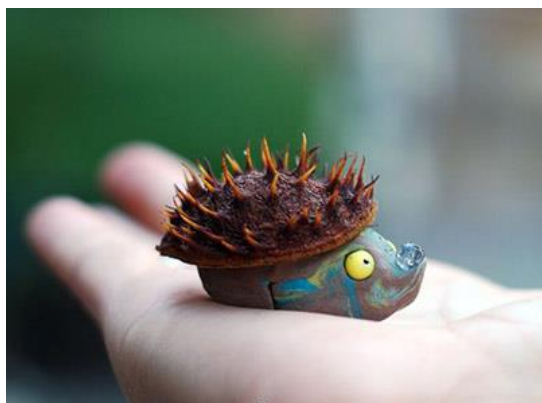
Ежик из каштана

Соединив при помощи пластилина друг с другом несколько плодов каштана, мы получим замечательную гусеницу. Достаточно дополнить ее подсушенными листьями деревьев – и полноценная композиция для осенней выставки поделок готова.