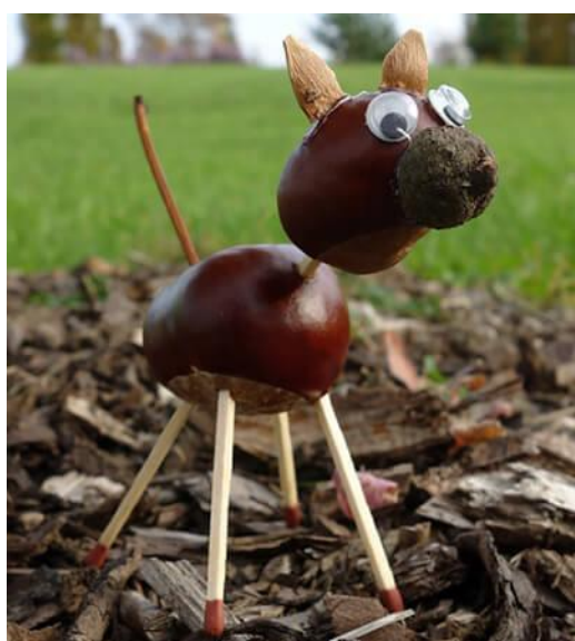
Лошадка из каштанов

Из перевернутой шляпки желудя получается замечательная мордочка осла или лошадки.