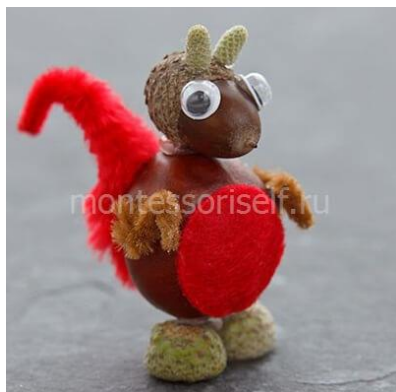
Белочка из желудя и каштана

Самый простой способ соединить между собой каштаны, семечки или желуди — это просто их склеить. Для таких поделок лучше всего использовать хороший клеевой пистолет.