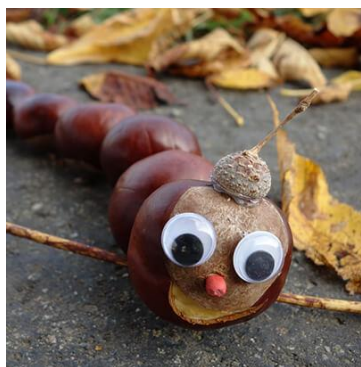
Гусеница из каштанов

Для изготовления змеек, гусениц или четок из каштанов подойдет «мягкий» способ крепления. Нанизываем на нитки каштаны один за другим протыкая их насквозь с помощью шила.