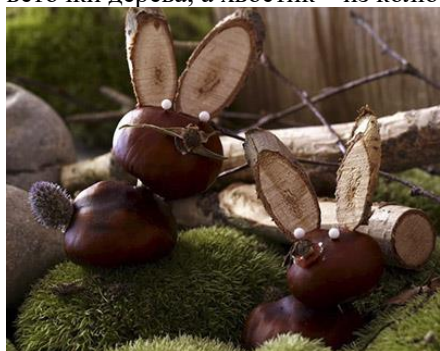
Зайчик из каштанов

Соединив друг с другом два каштана, мы получим тело и голову зайчика . Ушки делаем из спилов тонкой веточки дерева, а хвостик — из колочки. Для создания композиции помещаем заек на мох или травку.